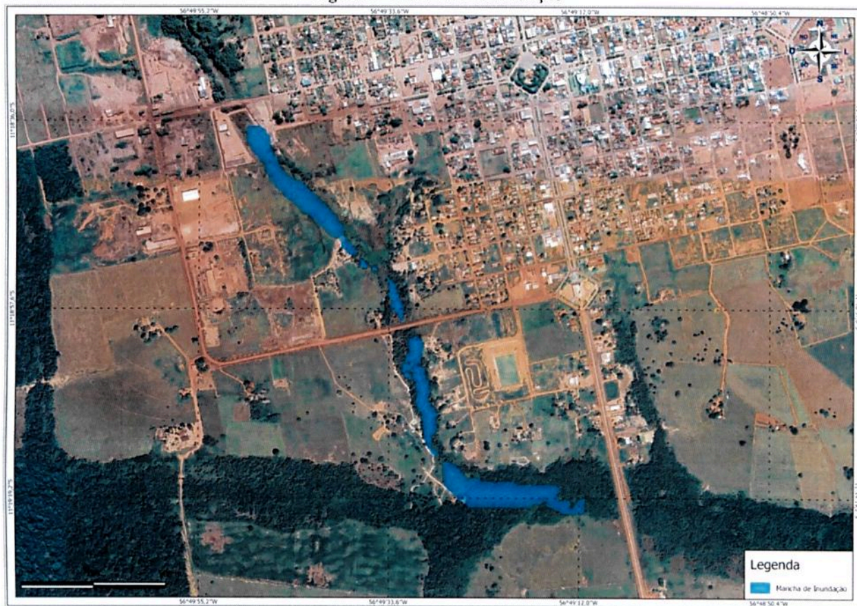
Figura 1 - Mancha de inundação